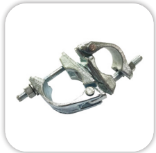
Forged swivel coupler