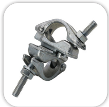
Forged double coupler